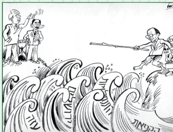
פורסם במעריב ב-1980. נתנם לארכיון בגין על ידי שמואל כץ.