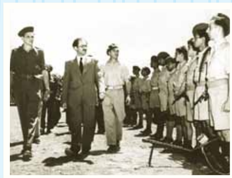
מנחם בגין במסדר החטיבה הירושלמית של האצ"ל.