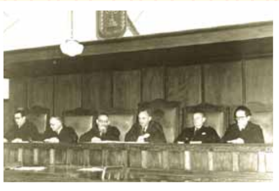
בית המשפט העליון, 1953.

"עליונות המשפט תתבטא בכך, שלחבר שופטים בלתי תלויים תוענק לא רק הסמכות לקבוע, במקרה של תלונה, או חוקיותה או צדקתה של פקודה או תקנה אדמיניסטרטיבית מטעם מוסדות השלטון המבצע, אלא גם הסמכות לחרוץ משפט, במקרה של קובלנה, האם החוקים, המתקבלים על-ידי בית הנבחרים... מתאימים לחוק היסוד או סותרים את זכויות האזרח שנקבעו בו. את זכות הגשת הקובלנה המשפטית ביחס ל"חוקים" יש להעניק לכל אזרח, אם הוא רואה את עצמו נפגע על ידם במישרין או בעקיפין ודבר המשפט יקום... למה יש וישאלונו - בשם ה"דמוקרטיה", כמובן: כלום זה דמוקרטי, שחמישה או שבעה או אחד-עשר אנשים, אשר לא נבחרו על-ידי העם, יוכלו לבטל על-ידי החלטתם הקרויה "פסק דין" החלטה שנתקבלה בצורת חוק על ידי נבחרים העם? זוהי שאלה מדיחת-דעת: הדמוקרטיה, המוצגת על ידי מי שהציג את השאלה הזאת, אינה אלא סילוף המושג של שלטון