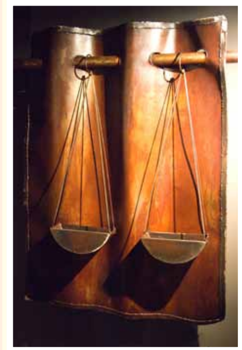
מאזני צדק מתוך מוזיאון בגין.

• כתבו "מכתב קוראים" בשמו של מנחם בגין, כתגובה לכתבה.