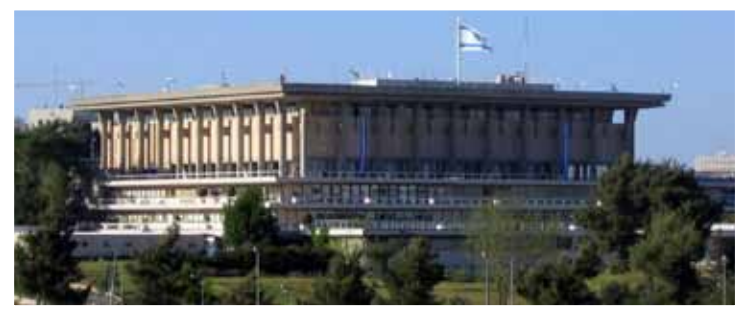
הכנסת מבט מדרום.

"מעשה ברבן גמליאל זקנים שהיו מסובין ביריחו, הביאו לפניהם כותבות (תמרים מיובשים) ואכלום. ונתן רבן גמליאל רשות לברך (ברכה אחרונה), קפץ רבי עקיבא וברך ברכה אחת מעין שלוש. אמר לו רבן גמליאל: עקיבא מה לך אתה מכניס ראשך בין המחלוקת? אמר לו: למדתנו רבינו 'אחרי רבים להטות', אף על פי שאתה אומר כך וחביריך אומרים כך, הלכה כדברי המרובין."