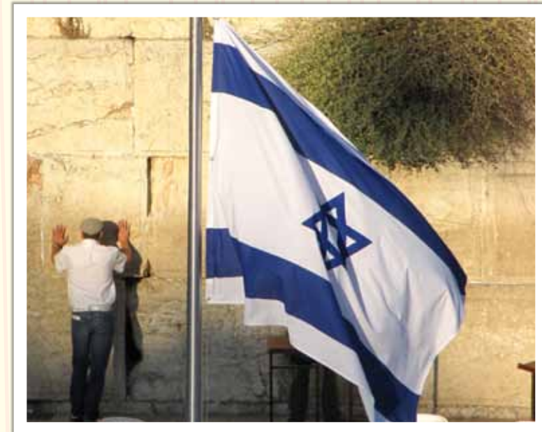
דגל ישראל בכותל המערבי.

מנחם בגין, עתון חרות, אל ננתק את הקשר בין עמנו לבין אלוהי אבותינו!, 11.07.1958.