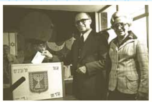
עליזה ומנחם בגין מצביעים בבחירות 1977, ערב המהפך.