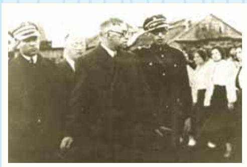
מנחם בגין במדי בית"ר (מצדיע) בעת ביקור זאב ז'בוטינסקי בפולין.

ביחידת לימוד זו, נבקש לבחון ולברר את תפיסת עולמו של בגין, את הערכים בהם האמין ושאותם ניסה להוציא אל הפועל עם היבחרו לשלטון. לא פחות חשוב מכך ברצוננו לבדוק את תקפותם של ערכים אלו אל מול המציאות של ימינו אנו. בחלקים השונים של חיבור זה ניסינו להביא מקורות נוספים מהתנ"ך, מהוגים שונים שכתבו בנושאים הנידונים וחומרים ויזואליים. אנו מקווים שתפיקו את המירב מהעיסוק בחומרים אלו ובמשמעותם.