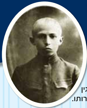
מנחם בגין בצעירותו.