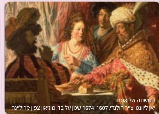
המשתה של אסתר יאן ליוונס, צייר הולנדי, 1607-1674 שמן על בד, מוזיאון צפון קרוליינה

לפי פירוש זה ולפי המדרש שמצוטט - האם אסתר זכתה לדורות? מה המשותף בין משה לאסתר, על פי מדרש זה? מה חלקו של מרדכי? מה ניתן ללמוד על שלוש דמויות אלה (משה, אסתר ומרדכי)?