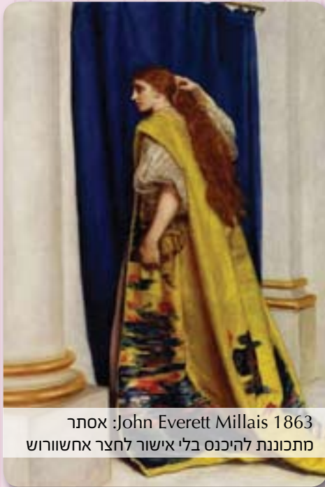
מתכוננת להיכנס בלי אישור לחצר אחשוורוש John Everett Millais 1863: אסתר

מנהיגות נשית, האם היא תכונה מולדת או שניתן לרכוש אותה?