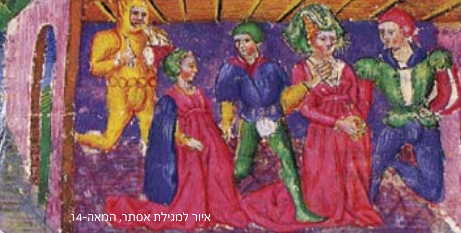
איור למגילת אסתר, המאה-14

... בצוותה על מרדכי: "לך כנוס את כל היהודים הנמצאים בשושן וצומו עלי ואל תאכלו ואל תשתו שלושת ימים לילה ויום, גם אני ונערותיי אצום כן..." הנערה הפסיבית מגלה לפתע תושייה, ומצווה על בני-עמה, באמצעות מרדכי, לעשות את אשר מקובל היה באותם ימים כאקט של התגוננות מראש מפני הרעה הצפויה - צום. שינוי זה בהתנהגותה מביא גם את הסופר המקראי