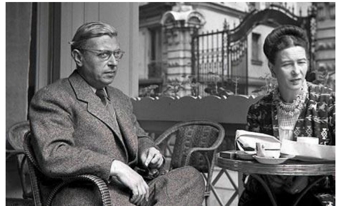
סימון דה-בובואר וז'אן פול סארטר בבית קפה בפאריז

ההתפתחות הטכנולוגית לא רק שלא הביאה לקידמה בתחום המוסרי, ההפך הוא הנכון – היא נותבה לכיוונים הרסניים! גרמניה הנאצית הובילה מלחמה עולמית עקובה מדם וביצעה, בעזרת שותפיה, השמדה המונית שבסיסה בעקרונות של חוסר שוויון ודה הומניזציה של עמים ותרבויות. על רקע זה ניתן להבין ביתר שאת את התפשטותה והתחזקותה של ההגות הקיומית בשנות ה-40 וה-50 של המאה ה-20. (פילוסופים וסופרים בולטים הם ז'אן פול סארטר, אלבר קאמי וסימון דה-בובואר).