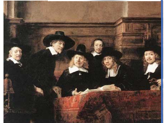
גילדת סוחרי בדים, רמברנט (1662)