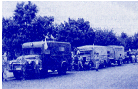
השיירה הדו שבועית להר הצופים

לסיכום: המנחה יקרא את דברי ש"י עגנון בטקס קבלת פרס נובל לספרות בשנת 1966: מתוך קטסטורפה היסטורית, שהחריב טיטוס מלך רומי את ירושלים וגלה ישראל מארצו, נולדתי אני באחת מערי הגולה. אבל בכל עת, תמיד דומה הייתי עלי כמי שנולד בירושלים. בחלום, בחזון לילה ראיתי את עצמי עומד עם אחי הלויים בבית המקדש כשאני שר עמהם שירי דוד מלך ישראל. בזכותה של ירושלים כתבתי את כל אשר נתן השם בלבי ובעטי.