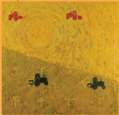
דיד רובין, טרקטוריום, שמן על בד

"ויקח בעץ את רות ותחי לו לאשה, ויבא אליה ... ותלד בן. ותאמרנה הנשים אל נעמי: כדרך הו', אשר לא השבית לך גאל היום... ותחיה לך למשיב נפש, ולכלכל את שובתך: כי בלתיך אשר אהבתך ילדתו, אשר היא טובה לך משבעה בנים. ותקח נעמי את הילד ותשתהו בחיקה, ותחי לו לאמנת. ותקראנה לו השכנות שם לאמר: ילד בן לנעמי, ותקראנה שמו עובד, הוא אבי ישי אבי דוד." (פסלת רות ד 17-13)