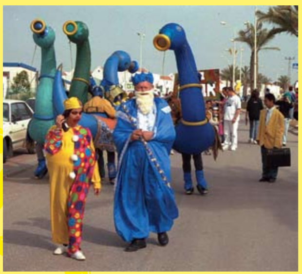
לישבת העתונות המסלולית, אוסף התצלומים הלאומי