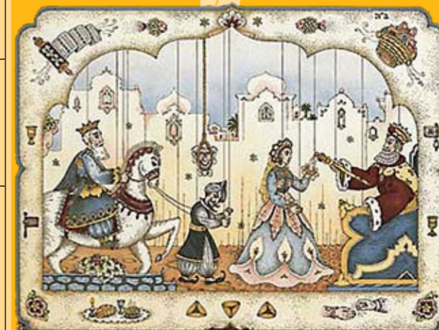
תהלוכת פורים (פורים שפיל)

שם: פורים מקור השם: ה"פור" (גורל) שהטיל המן לקביעת מועד השמדת היהודים. מועד: י"ד באדר (ובערים המוקפות חומה מתקופת המקרא דוגמת ירושלים: ט"ו באדר - שושן פורים). הורים מייסדים: אסתר ומרדכי רקע היסטורי: גלות-בבל ופרס (החל מן המאה הששית לפה"ס). מצוות מרכזיות: קריאת מגילת אסתר בבית הכנסת, סעודת חג, משלוח מנות, מתנות לאביונים. מנהגים נוספים: אכילת אזני המן, הרעשה ברעשנים בעת קריאת שמו של המן במגילה, מסכות ותחפושות, "עדלאידע". משמעויות: הצלה מהשמדה, נס בדרך הטבע, זהות יהודית בגולה, מעמד האישה.