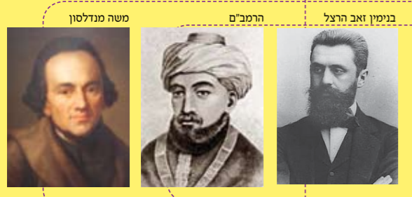
בנימין זאב הרצל, הרמב"ם, משה מנדלסון