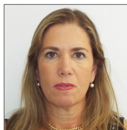
דבר מפקחת מחוז תל אביב