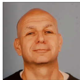
מנהל תיכון שש שנת "יובלים" אור יהודה