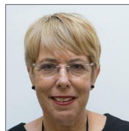
דבר מנהלת מחוז תל אביב