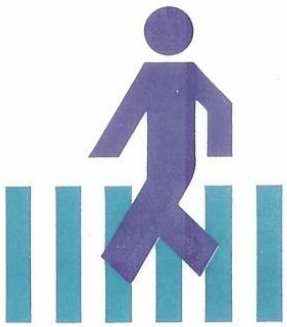
הולך רגל - חצה את הכביש רק במעבר חצייה!