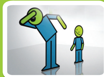
משתעלים ומתעטשים אל המרפק

מידע והנחיות למורים לגננות ולהורים תוכלו למצוא באתר משרד הבריאות: