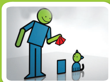
משליכים לפח את ממחטות הנייר