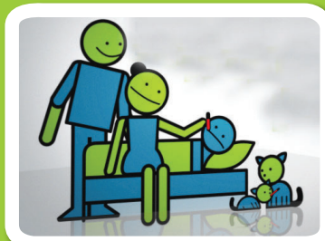
לא שולחים ילד חולה לביה"ס או לגן