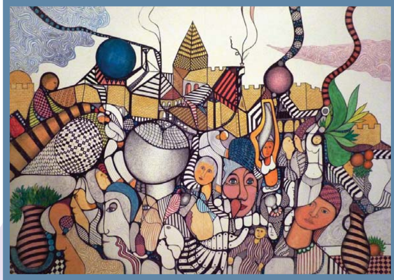
באדיבות הצייר אבי צרפתי

'קיבוץ גלויות בירושלים' מאת האומן הישראלי אבי צרפתי: