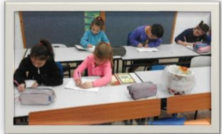
עידוד כתיבה חופשית. הבנות כותבות בכל בוקר כ-10 דקות.