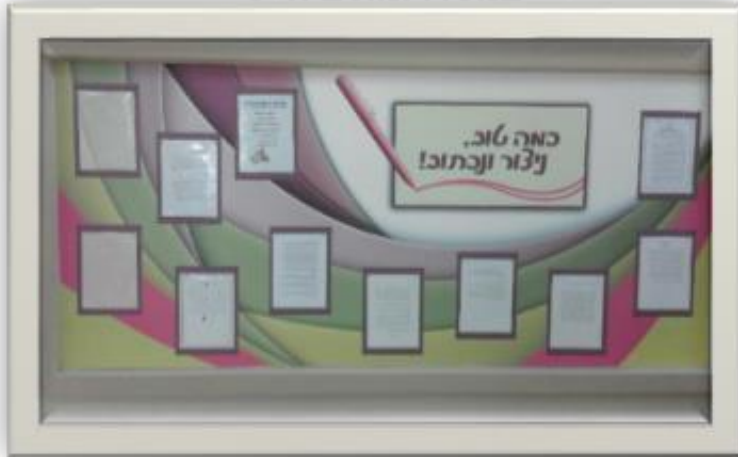
פרסום הכתיבה של תלמידים במסדרונות ביה"ס