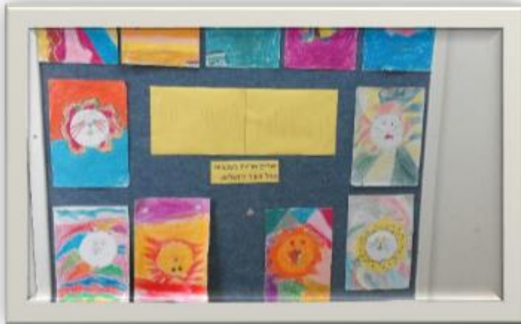
ירושלים - יצירה בעקבות סמל העיר ירושלים