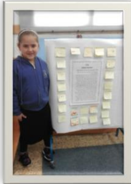
כתיבת משוב על סיפור