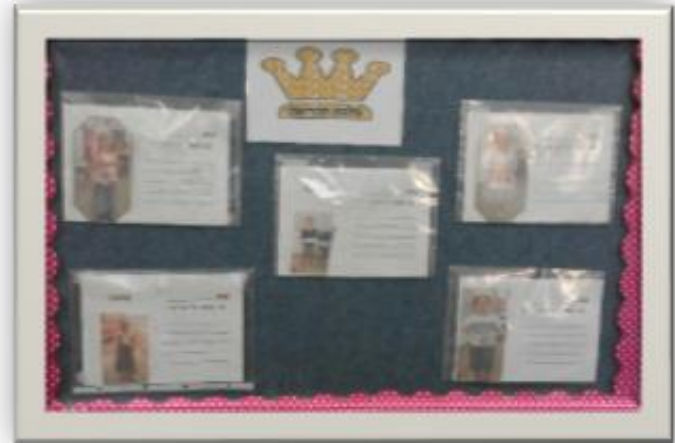
מלכת הקריאה במסגרת עידוד קריאה