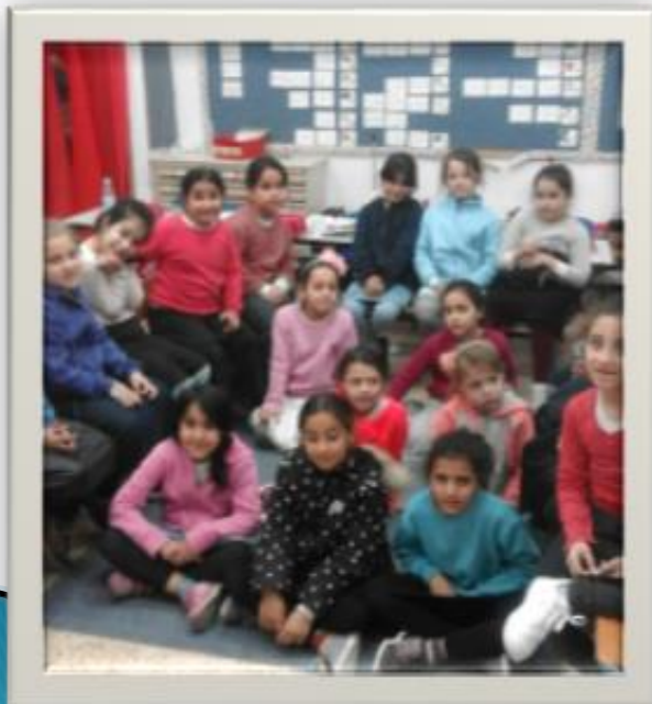
הבנות יושבות במליאה ומאזינות לקריאה קולית או הקנייה