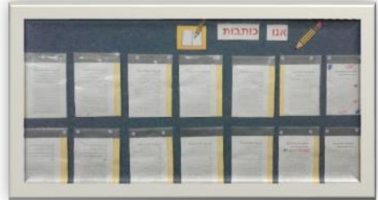
לוח כתיבה בכיתה