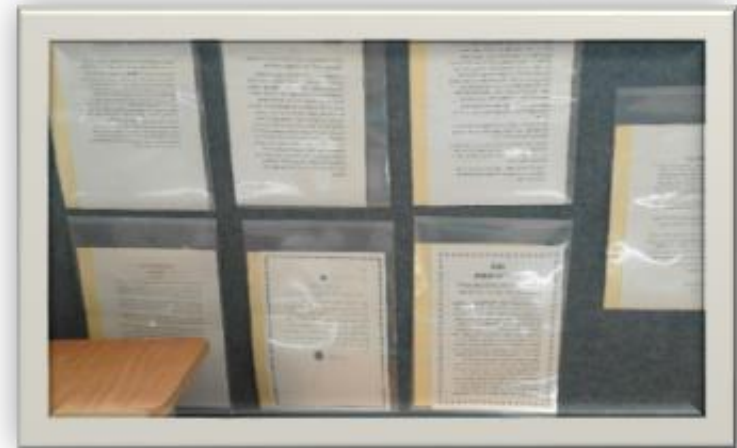
בנות כיתה ב' כותבות