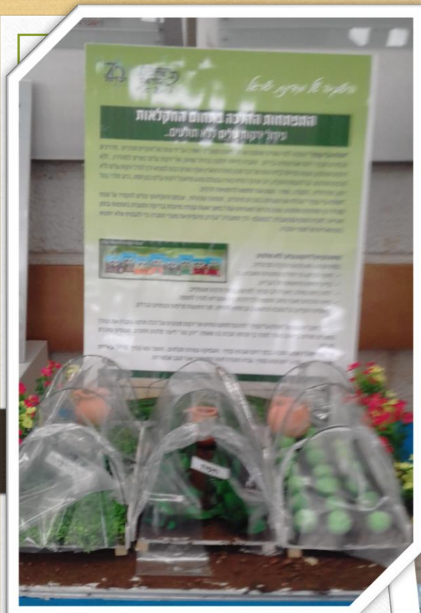
התפתחות ההלכה בתחום החקלאות