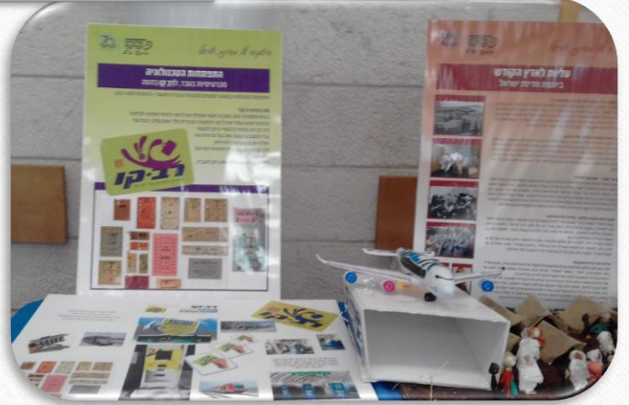
התפתחות טכנולוגית- הרב קו