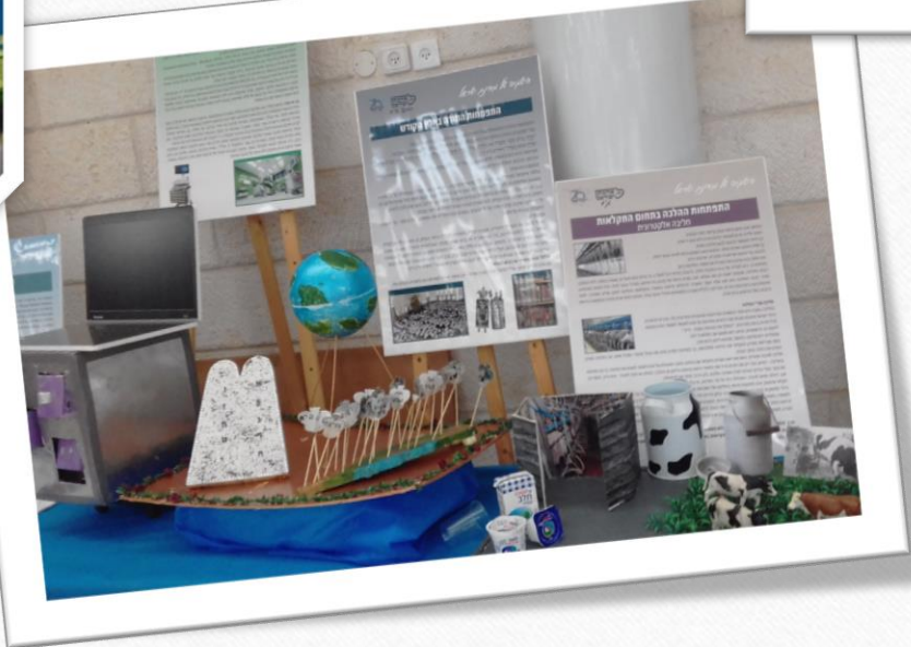
התפתחות הישיבות בארץ