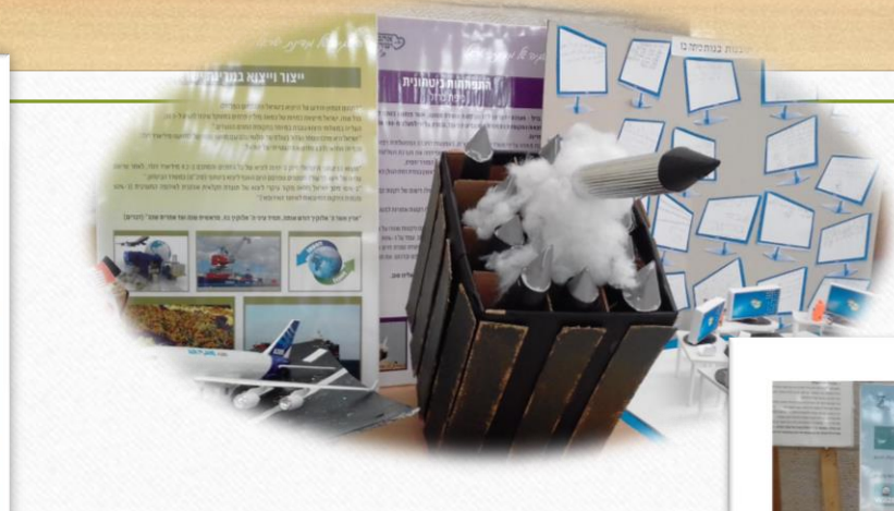
התפתחות טכנולוגית- כיפת ברזל