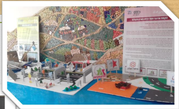
ארגוני חסד- זכרון מנחם