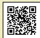
שיר: אנחנו עולים אליך ירושלים