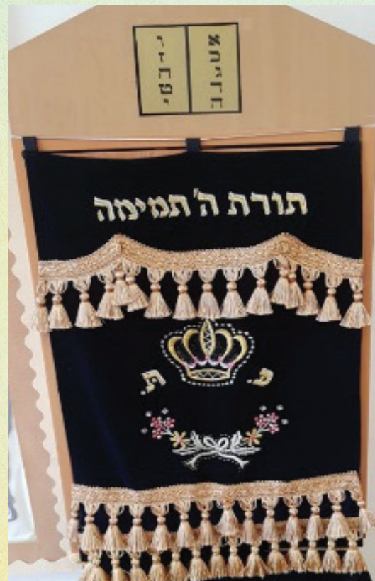
ארון קודש בגן הילדים | צילום: חלי אבהר