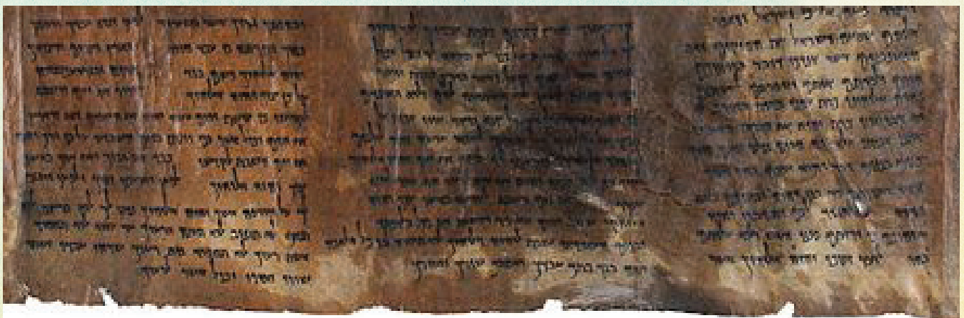
עשרת הדיברות במגילה עתיקה מהמאה הראשונה (מתוך ויקפדיה)

"כל שש מאות ושלש עשרה מצות - בכלל עשרת הדיברות" (רש"י, שמות כד, יב). עשרת הדיברות, החקוקים על לוחות הברית, הם המצוות הראשונות שקיבלו ישראל, ומהם נגזרות המצוות כולן. כך יוצא שהתורה כולה ניתנה באופן תמציתי לבני ישראל בהר סיני.