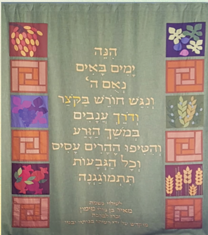
פרוכת בבית הכנסת המרכזי בבית חורון תפרה עדינה גת

כדאי לשאול את הילדים מדוע לדעתם הפרוכת בבתי הכנסת תפורות מבדים יקרים ורקומות באיורים מיוחדים.