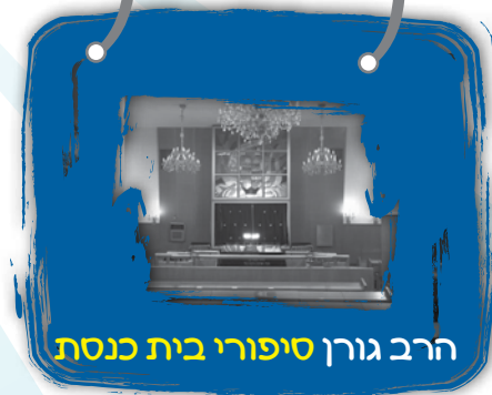
הרב גורן סיפורי בית כנסת