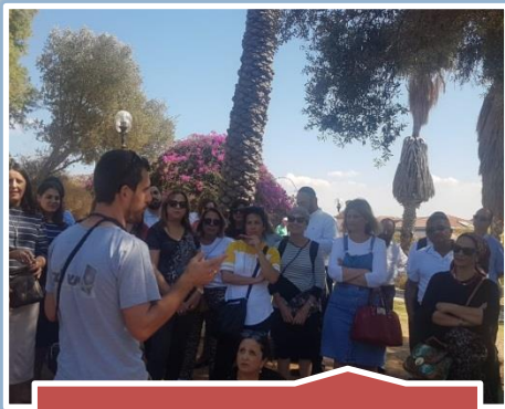
מפקחי המחוז וצוות המינהלה השתתפו בימי גיבוש ועיון מחוזיים