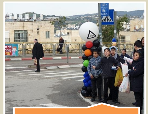
תרגול חציה בטוחה במרחב הציבורי בביתר עלית