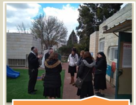
סיור של המשרד לאיכות הסביבה והפיקוח בגן בביתר