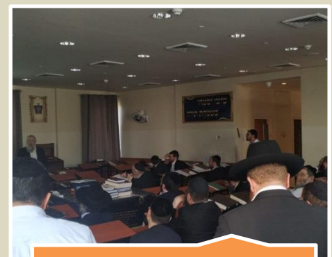
מפגש ראשי ישיבות עם המפמ"ר לתושב"ע