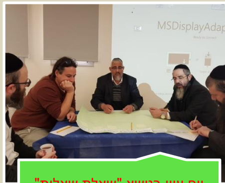
יום עיון בנושא "שאלת שאלות" בארגון צוות מרום מחוזי