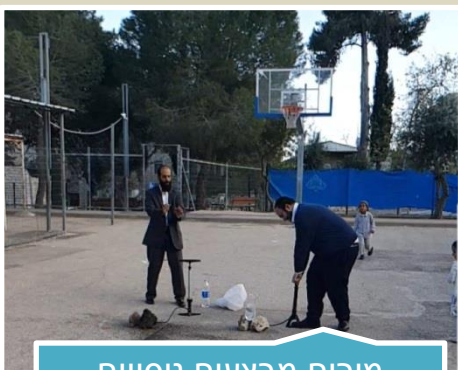
מורים מבצעים ניסויים במדעים במסגרת פיתוח מקצועי למורי מדעים