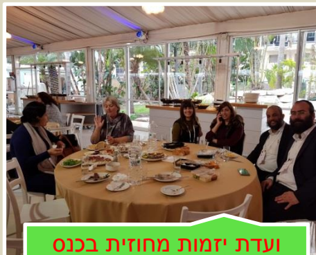
ועדת יזמות מחוזית בכנס שנתי של הקרן לעידוד יזמות חינוכיות