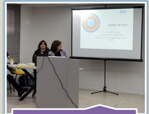
יום עיון במסגרת מחוז מארח את מטה ניצנים