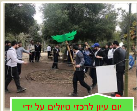
יום עיון לרכזי טיולים על ידי מינהל חברה ונוער בשיתוף עם קק"ל