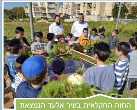
החוג החקלאית בעיר אלעד הנמצאת בפיקוח המחוז התקיימה מצוות הפרשת תרומות ומעשרות בשיתוף התלמידים