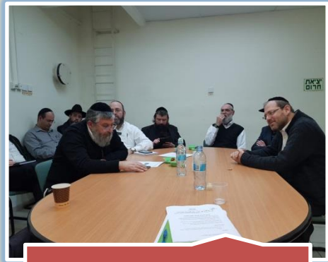
מפקחי היסודי במפגש בנושא שפה ותושב"ע