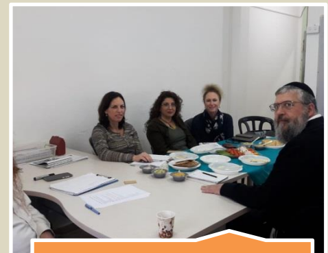
מפקחי היסודי בממ"ח מקיימים בימים אלו וועדות מלוות בשיתוף עם מחלקת החינוך ברשות