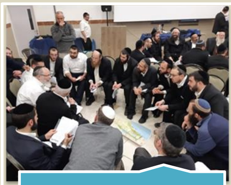
השתלמות לאחראי טיול תחת פיקוח מינהל חברה ונוער