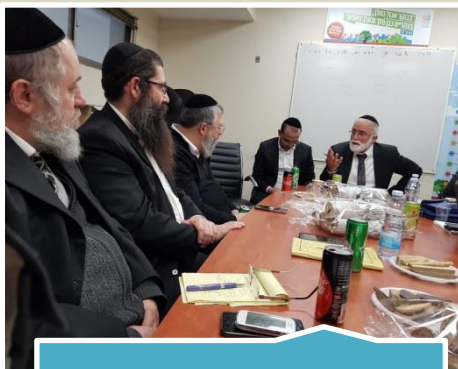
מפקחי היסודי ביום עבודה עם עמיתים בשטח בעיריית אשדוד