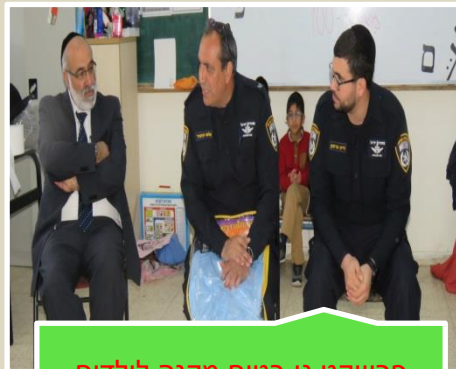
פרוייקט גן בטוח מקנה לילדים כלים להתנהלות בטוחה