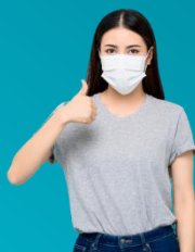
הקפדה על שימוש במסכה

החזרה ההדרגתית לשגרת פעילות ולימודים בבתי הספר מציבה בפני כולנו אתגר הכרחי של שינוי התפישה הבריאותית, תוך יישום אורח חיים בריא, והיא מהווה את אחד התנאים הראשונים לתחילתה של שגרה במדינתנו.