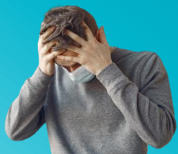
לא להגיע לבית הספר כשחולים