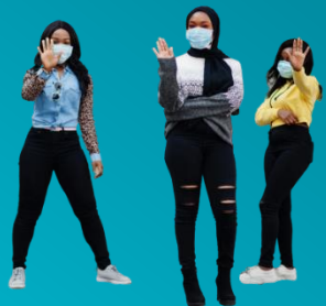
שמירה על מרחק פיסי של 2 מטרים