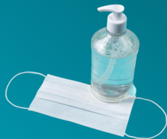
שמירה על היגיינה אישית