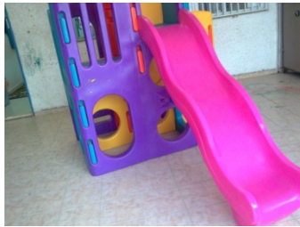
מתקן משחק שאינו מתאים לדרישות ת"י 1498. הוצב על רצפה קשיחה, מורכב מחומרים בעלי עמידות נמוכה.

מטרת מסמך זה להאיר את עיני הגננות ומנהלי הבטיחות ברשויות ובמועצות המקומיות ולהנחות כיצד לבחור במתקני משחק בטוחים וכיצד לתחזקם נכונה כדי לשמור על בטיחות ילדי הגן.