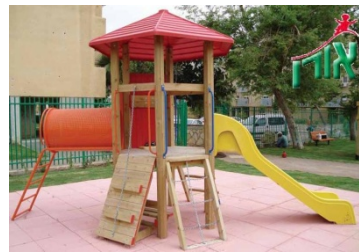
מתקן משחק מתאים לדרישות ת"י 1498. הוצב על משטח סופג אנרגיה, התקנתו בהתאם לדרישות התקן נבחנה ואושרה.