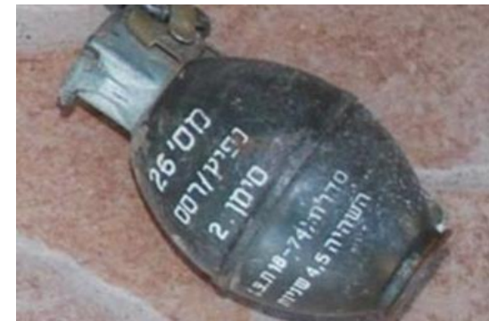
רימון שנזרק ללא נצרה