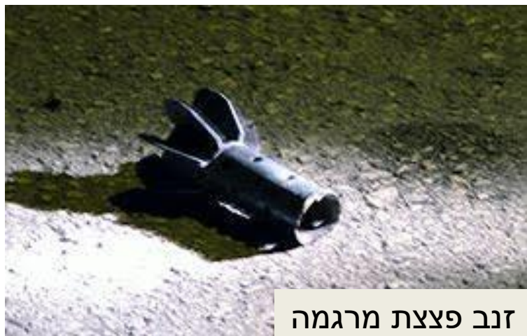
זנב פצצת מרגמה