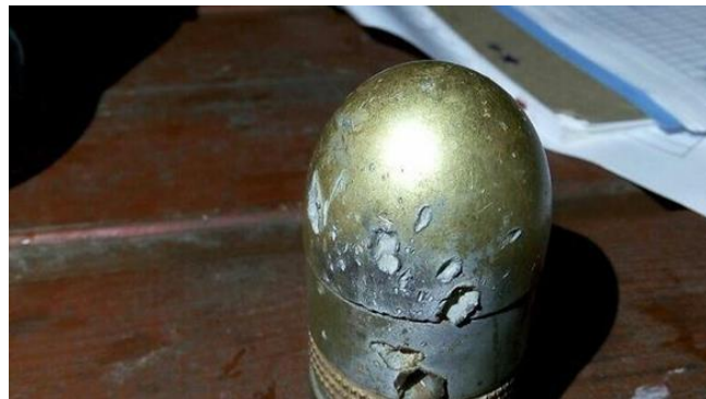
רימון שנורה ולא התפוצץ