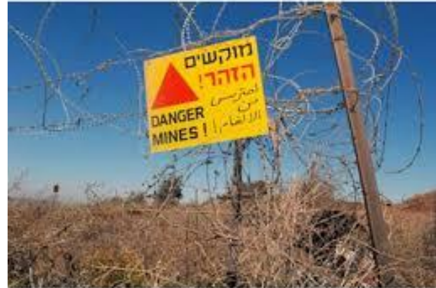
גדר תלתלית מקיפה שדה מוקשים

סרטון הסברה בנושא שדות מוקשים – סרטון חובה לצפייה בהדרכה (מומלץ לשלוח גם בווצאפ לתלמידים/צוות חינוכי בסוף ההדרכה)