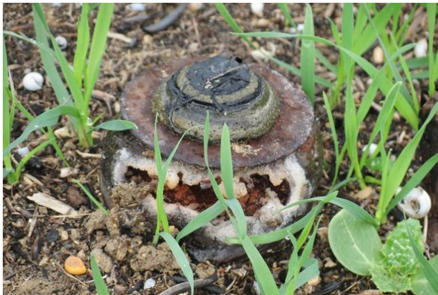
מוקש נגד בני אדם נסתר בין השיחים