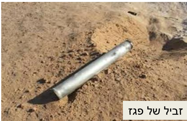
זביל של פגז